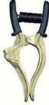
XL-3027 全铜接地钳 毛/净重 G.W/N.W(kg) 24/22kg 装箱数 QTY(pcs) 50pcs 外箱尺寸 MEAS(cm) 49 x 22 x 26cm