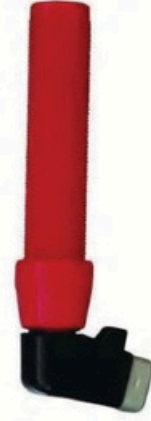
XL-2016 虎头式500A 毛/净重 G.W/N.W(kg) 22/20kg 装箱数 QTY(pcs) 50pcs 外箱尺寸 MEAS(cm) 46 x 35 x 25cm