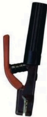
XL-2001 日本式3000A 毛净重 外箱尺寸 G.WIN.W(kg) MEAS(cm) 22/20kg 46 x 36 x 25cm 50pcs