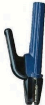
XL-2049 新款荷兰式300A 毛/净重 G.WIN/W(kg) 18/17kg 装箱数 QTY(pcs) 40pcs 外箱尺寸 MEAS(cm) 52 x 32.5 x 25cm