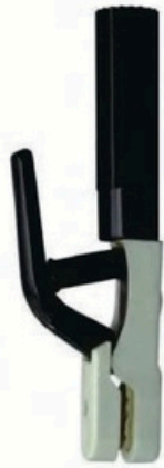
XL-2009 法式500A 毛/净重 G.W/N.W(kg) 14/13kg 22/20kg 装箱数 QTY(pcs) 25pcs 50pcs 外箱尺寸 MEAS(cm) 50 x 20 x 28.5cm 50 x 40 x 28.5cm