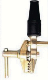
XL-3022 全铜 600A 毛/净重 G.W/N.W(kg) 26/25kg 装箱数 QTY(pcs) 40pcs 外箱尺寸 MEAS(cm) 30 x 28 x 21cm