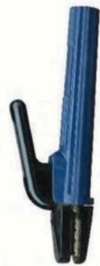
XL-2050 新款荷兰式500A 毛/净重 G.WIN/W(kg) 19/18kg 装箱数 QTY(pcs) 25pcs 外箱尺寸 MEAS(cm) 54.5 x 23 x 30cm