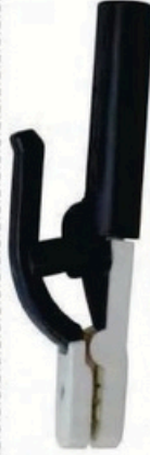
XL-2036 韓國式500A 毛淨重 G.WIN.W(kg) 24/22kg 裝箱數 QTY(pcs) 50pcs 外箱尺寸 MEAS(cm) 46 x 38 x 27cm