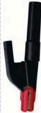
XL-2046 意大利式600A 毛/净重 G.WIN/W(kg) 13/12kg 装箱数 QTY(pcs) 25pcs 外箱尺寸 MEAS(cm) 54 x 20 x 28.5cm