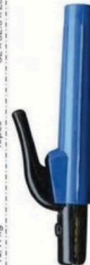
XL-2051 加长荷兰式500A 毛/净重 G.WIN/W(kg) 16/15kg 装箱数 QTY(pcs) 25pcs 外箱尺寸 MEAS(cm) 52 x 23 x 30cm