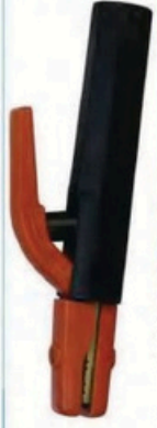
XL-2026 尖頭美式200A 毛淨重 G.WIN.W(kg) 20/18kg 裝箱數 QTY(pcs) 50pcs 外箱尺寸 MEAS(cm) 46 x 36 x 25cm