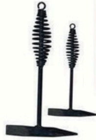
XL-3023 敲液锤 毛/净重 G.W/N.W(kg) 26/25kg 装箱数 QTY(pcs) 40pcs 外箱尺寸 MEAS(cm) 30 x 28 x 21cm