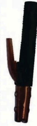
XL-2039 尖頭美式600A 毛淨重 G.WIN.W(kg) 17/16kg 裝箱數 QTY(pcs) 25pcs 外箱尺寸 MEAS(cm) 45 x 23 x 31cm