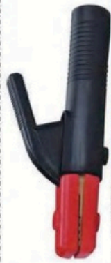
XL-2065 意大利式200A 毛/净重 G.WIN/W(kg) 17/15kg 装箱数 QTY(pcs) 50pcs 外箱尺寸 MEAS(cm) 45 x 38 x 23cm