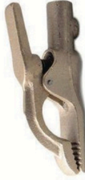
XL-3017 全铜 300A 毛/净重 G.W/N.W(kg) 21/20kg 装箱数 QTY(pcs) 50pcs 外箱尺寸 MEAS(cm) 36 x 36 x 15cm