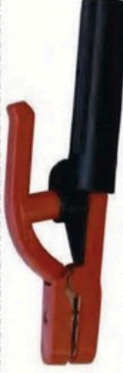
XL-2035 韓國式500A 毛淨重 G.WIN.W(kg) 24/22kg 裝箱數 QTY(pcs) 50pcs 外箱尺寸 MEAS(cm) 46 x 38 x 27cm