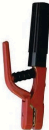
XL-2004 日本式5000A 毛净重 外箱尺寸 G.WIN.W(kg) MEAS(cm) 14/13kg 50 x 20 x 28.5cm 22/20kg 50 x 40 x 28.5cm 25pcs 50pcs