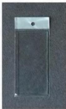
XL-1003 电焊护目镜片 Size: 105 x 50mm 108 x 50mm 110 x 50mm 毛净重 外箱尺寸 G.WIN.W(kg) MEAS(cm) 45/42kg 42 x 35 x 30cm(木箱) 17/16kg 38 x 25 x 13cm(纸箱) 600pcs 1500pcs