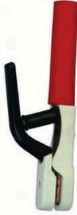
XL-2010 日式500A 毛/净重 G.W/N.W(kg) 14/13kg 22/20kg 装箱数 QTY(pcs) 25pcs 50pcs 外箱尺寸 MEAS(cm) 50 x 20 x 28.5cm 50 x 40 x 28.5cm