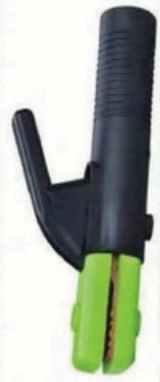
XL-2066 意大利式200A 毛/净重 G.WIN/W(kg) 17/15kg 装箱数 QTY(pcs) 50pcs 外箱尺寸 MEAS(cm) 45 x 38 x 23cm