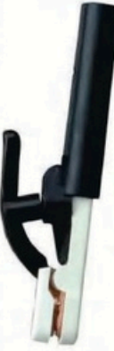
XL-2038 韓國式300A 毛淨重 G.WIN.W(kg) 21/19kg 裝箱數 QTY(pcs) 50pcs 外箱尺寸 MEAS(cm) 46 x 38 x 27cm