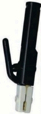
XL-2042 德国式600A 毛/净重 G.WIN/W(kg) 15/14kg 装箱数 QTY(pcs) 25pcs 外箱尺寸 MEAS(cm) 49 x 22 x 28cm