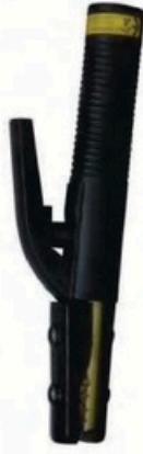
XL-2031 尖頭美式500A 毛淨重 G.WIN.W(kg) 19/18kg 裝箱數 QTY(pcs) 25pcs 外箱尺寸 MEAS(cm) 45 x 23 x 31cm