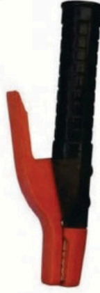
XL-2014 毛/净重 G.W/N.W(kg) 22/20kg 装箱数 QTY(pcs) 40pcs 外箱尺寸 MEAS(cm) 49 x 39 x 29cm