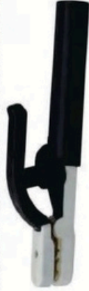
XL-2040 韓國式500A 毛淨重 G.WIN.W(kg) 24/22kg 裝箱數 QTY(pcs) 50pcs 外箱尺寸 MEAS(cm) 49 x 38 x 31.5cm