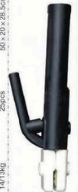
XL-2055 德国式200A 毛/净重 G.WIN/W(kg) 12/11kg 装箱数 QTY(pcs) 50pcs 外箱尺寸 MEAS(cm) 44 x 38 x 22.5cm