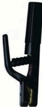
XL-2008 日本式5000A 毛净重 外箱尺寸 G.WIN.W(kg) MEAS(cm) 14/13kg 50 x 20 x 28.5cm 22/20kg 50 x 40 x 28.5cm 25pcs 50pcs