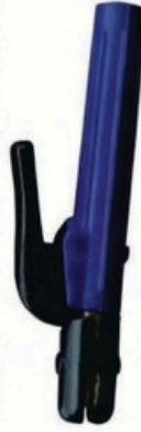
XL-2021 荷兰式600A 毛/净重 G.W/N.W(kg) 13/12kg 21/20kg 装箱数 QTY(pcs) 25pcs 50pcs 外箱尺寸 MEAS(cm) 42 x 22 x 29cm 44 x 42 x 29cm