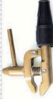
XL-3029 全铜接地钳 毛/净重 G.W/N.W(kg) 18/17kg 装箱数 QTY(pcs) 20pcs 外箱尺寸 MEAS(cm) 46 x 19 x 21cm