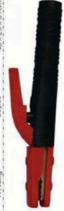
XL-2032 尖頭美式600A 毛淨重 G.WIN.W(kg) 17/16kg 裝箱數 QTY(pcs) 25pcs 外箱尺寸 MEAS(cm) 45 x 23 x 31cm