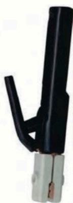
XL-2041 德国式500A 毛/净重 G.WIN/W(kg) 20/18kg 装箱数 QTY(pcs) 50pcs 外箱尺寸 MEAS(cm) 46 x 38 x 27cm