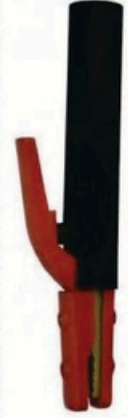
XL-2030 尖頭美式800A 毛淨重 G.WIN.W(kg) 17/16kg 裝箱數 QTY(pcs) 25pcs 外箱尺寸 MEAS(cm) 45 x 23 x 31cm 48 x 25 x 31cm