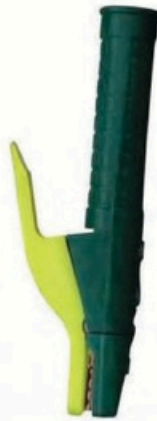
XL-2013 毛/净重 G.W/N.W(kg) 22/20kg 装箱数 QTY(pcs) 40pcs 外箱尺寸 MEAS(cm) 49 x 39 x 29cm