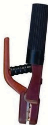
XL-2007 日本式5000A 毛净重 外箱尺寸 G.WIN.W(kg) MEAS(cm) 14/13kg 50 x 20 x 28.5cm 22/20kg 50 x 40 x 28.5cm 25pcs 50pcs