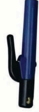
XL-2024 封閉荷兰式500A 毛/净重 G.W/N.W(kg) 13/12kg 21/20kg 装箱数 QTY(pcs) 25pcs 50pcs 外箱尺寸 MEAS(cm) 42 x 22 x 29cm 44 x 42 x 29cm