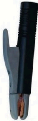
XL-2011 法式500A 毛/净重 G.W/N.W(kg) 15/14kg 装箱数 QTY(pcs) 25pcs 外箱尺寸 MEAS(cm) 52 x 20 x 29cm