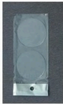
XL-1005 电焊护目镜片 Size: 105 x 50mm 108 x 50mm 110 x 50mm 毛净重 外箱尺寸 G.WIN.W(kg) MEAS(cm) 28/25kg 42 x 35 x 30cm(木箱) 12/11kg 38 x 25 x 13.5cm(纸箱) 2000pcs 8000pcs