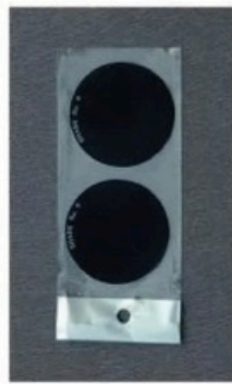
XL-1006 电焊护目镜片 Size: 108 x 80mm 108 x 83mm 110 x 90mm 毛净重 外箱尺寸 G.WIN.W(kg) MEAS(cm) 28/25kg 42 x 35 x 30cm(木箱) 12/11kg 38 x 25 x 13.5cm(木箱) 2000pcs 8000pcs