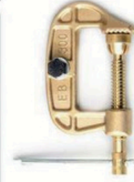
XL-3025 C型 300A 全铜接地钳 毛/净重 G.W/N.W(kg) 20/18kg 装箱数 QTY(pcs) 100pcs 外箱尺寸 MEAS(cm) 64 x 43 x 19cm