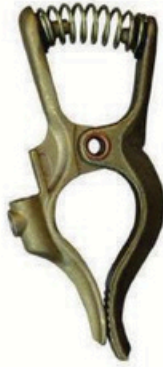
XL-3019 全铜 毛/净重 G.W/N.W(kg) 16/14kg 装箱数 QTY(pcs) 25pcs 外箱尺寸 MEAS(cm) 51 x 16 x 22cm