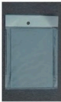
XL-1004 电焊护目镜片 Size: 108 x 80mm 108 x 83mm 110 x 90mm 毛净重 外箱尺寸 G.WIN.W(kg) MEAS(cm) 30/27kg 45 x 24 x 29cm(木箱) 800pcs