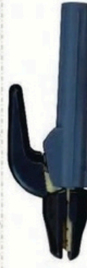
XL-2023 荷兰式500A 毛/净重 G.W/N.W(kg) 15/14kg 装箱数 QTY(pcs) 25pcs 外箱尺寸 MEAS(cm) 52 x 22 x 27cm