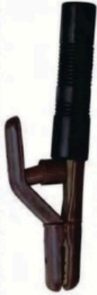
XL-2027 圓頭美式500A 毛淨重 G.WIN.W(kg) 26/25kg 裝箱數 QTY(pcs) 26/25pcs 外箱尺寸 MEAS(cm) 56 x 23.5 x 34.5cm