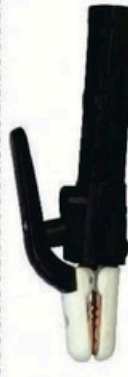
XL-2047 轻型式300A 毛/净重 G.WIN/W(kg) 16/15kg 装箱数 QTY(pcs) 50pcs 外箱尺寸 MEAS(cm) 46 x 36 x 25cm