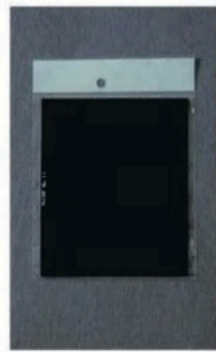
XL-1002 电焊护目镜片 Size: 108 x 60mm 108 x 63mm 110 x 60mm 毛净重 外箱尺寸 G.WIN.W(kg) MEAS(cm) 30/27kg 45 x 24 x 29cm(木箱) 400pcs