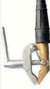
XL-3030 上铁下铜 毛/净重 G.W/N.W(kg) 18/17kg 装箱数 QTY(pcs) 20pcs 外箱尺寸 MEAS(cm) 46 x 19 x 21cm