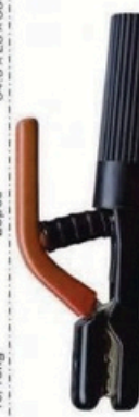
XL-2052 新款日本式500A 毛/净重 G.WIN/W(kg) 14/13kg 装箱数 QTY(pcs) 25pcs 外箱尺寸 MEAS(cm) 50 x 20 x 28.5cm