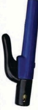
XL-2022 封閉荷兰式300A 毛/净重 G.W/N.W(kg) 21/19kg 装箱数 QTY(pcs) 50pcs 外箱尺寸 MEAS(cm) 42 x 36 x 25cm