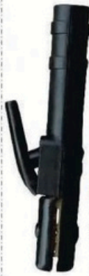
XL-2044 德国式500A 毛/净重 G.WIN/W(kg) 24/22kg 装箱数 QTY(pcs) 50pcs 外箱尺寸 MEAS(cm) 46 x 38 x 27cm