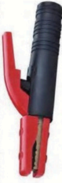
XL-2028 尖頭美式300A 毛淨重 G.WIN.W(kg) 15/14kg 裝箱數 QTY(pcs) 25pcs 外箱尺寸 MEAS(cm) 45 x 23 x 29cm