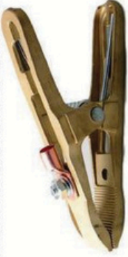
XL-3020 全铜 毛/净重 G.W/N.W(kg) 18/17kg 装箱数 QTY(pcs) 50pcs 外箱尺寸 MEAS(cm) 39 x 35 x 23cm