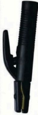
XL-2029 尖頭美式300A 毛淨重 G.WIN.W(kg) 15/14kg 裝箱數 QTY(pcs) 25pcs 外箱尺寸 MEAS(cm) 45 x 23 x 29cm