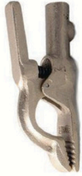
XL-3018 全铜 500A 毛/净重 G.W/N.W(kg) 16/15kg 装箱数 QTY(pcs) 20pcs 外箱尺寸 MEAS(cm) 37 x 20 x 21cm