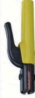
XL-2059 荷兰式300A 毛/净重 G.W/N.W(kg) 22/20kg 装箱数 QTY(pcs) 50pcs 外箱尺寸 MEAS(cm) 42 x 36 x 25cm