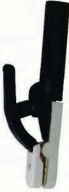
XL-2034 韓國式300A 毛淨重 G.WIN.W(kg) 21/19kg 裝箱數 QTY(pcs) 50pcs 外箱尺寸 MEAS(cm) 46 x 36 x 25cm