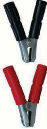
XL-3024 接地钳 毛/净重 G.W/N.W(kg) 21/20kg 装箱数 QTY(pcs) 30pcs 外箱尺寸 MEAS(cm) 66 x 41 x 19cm