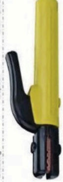
XL-2060 荷兰式500A 毛/净重 G.W/N.W(kg) 13/12kg 21/20kg 装箱数 QTY(pcs) 25pcs 50pcs 外箱尺寸 MEAS(cm) 42 x 22 x 29cm 44 x 42 x 29cm