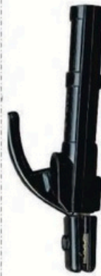
XL-2056 德国式200A 毛/净重 G.WIN/W(kg) 13/12kg 装箱数 QTY(pcs) 50pcs 外箱尺寸 MEAS(cm) 44 x 34 x 22cm