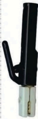
XL-2043 德国式800A 毛/净重 G.WIN/W(kg) 16/15kg 装箱数 QTY(pcs) 25pcs 外箱尺寸 MEAS(cm) 49 x 22 x 28cm