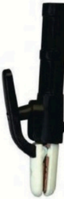
XL-2048 轻型式500A 毛/净重 G.WIN/W(kg) 18/17kg 装箱数 QTY(pcs) 50pcs 外箱尺寸 MEAS(cm) 46 x 38 x 27cm