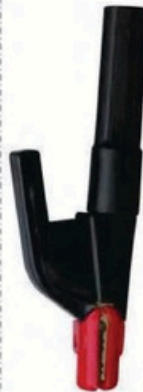
XL-2045 意大利式500A 毛/净重 G.WIN/W(kg) 13/12kg 装箱数 QTY(pcs) 25pcs 外箱尺寸 MEAS(cm) 54 x 20 x 28.5cm 54 x 38 x 28.5cm