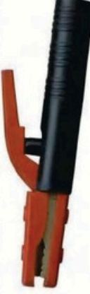
XL-2037 尖頭美式500A 毛淨重 G.WIN.W(kg) 17/16kg 裝箱數 QTY(pcs) 25pcs 外箱尺寸 MEAS(cm) 45 x 23 x 31cm