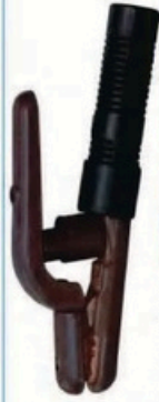
XL-2025 圓頭美式300A 毛淨重 G.WIN.W(kg) 16/15kg 裝箱數 QTY(pcs) 25pcs 外箱尺寸 MEAS(cm) 52 x 21 x 27cm