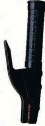
XL-2015 毛/净重 G.W/N.W(kg) 22/20kg 装箱数 QTY(pcs) 40pcs 外箱尺寸 MEAS(cm) 49 x 39 x 29cm