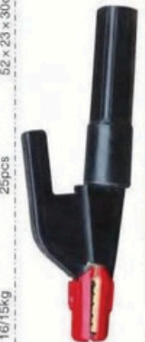
XL-2053 意大利式600A 毛/净重 G.WIN/W(kg) 16/15kg 装箱数 QTY(pcs) 25pcs 外箱尺寸 MEAS(cm) 56 x 20 x 29cm