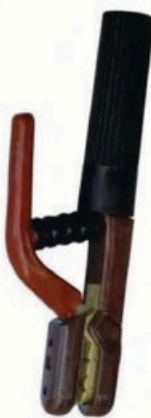
XL-2005 日本式5000A 毛净重 外箱尺寸 G.WIN.W(kg) MEAS(cm) 14/13kg 50 x 20 x 28.5cm 25pcs