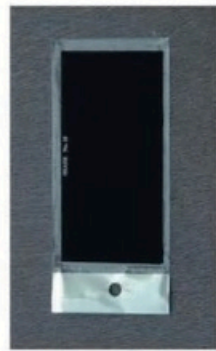
XL-1001 电焊护目镜片 Size: 105 x 50mm 105 x 50mm 110 x 50mm 毛净重 外箱尺寸 G.WIN.W(kg) MEAS(cm) 30/27kg 42 x 35 x 30cm(木箱) 17/16kg 38 x 25 x 13cm(纸箱) 400pcs 1000pcs 1000pcs