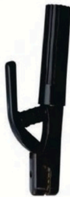
XL-2006 日本式3000A 毛净重 外箱尺寸 G.WIN.W(kg) MEAS(cm) 22/20kg 46 x 36 x 25cm 50pcs