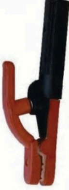
XL-2033 韓國式300A 毛淨重 G.WIN.W(kg) 21/19kg 裝箱數 QTY(pcs) 50pcs 外箱尺寸 MEAS(cm) 46 x 36 x 25cm