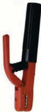
XL-2002 日本式3000A 毛净重 外箱尺寸 G.WIN.W(kg) MEAS(cm) 22/20kg 46 x 36 x 25cm 50pcs