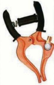
XL-3021 毛/净重 G.W/N.W(kg) 24/22kg 装箱数 QTY(pcs) 50pcs 外箱尺寸 MEAS(cm) 49 x 22 x 26cm