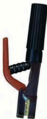
XL-2003 日本式5000A 毛净重 外箱尺寸 G.WIN.W(kg) MEAS(cm) 14/13kg 50 x 20 x 28.5cm 22/20kg 50 x 40 x 28.5cm 25pcs 50pcs