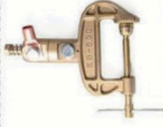
XL-3028 全铜 500A 方向 毛/净重 G.W/N.W(kg) 16/15kg 装箱数 QTY(pcs) 20pcs 外箱尺寸 MEAS(cm) 37 x 20 x 21cm